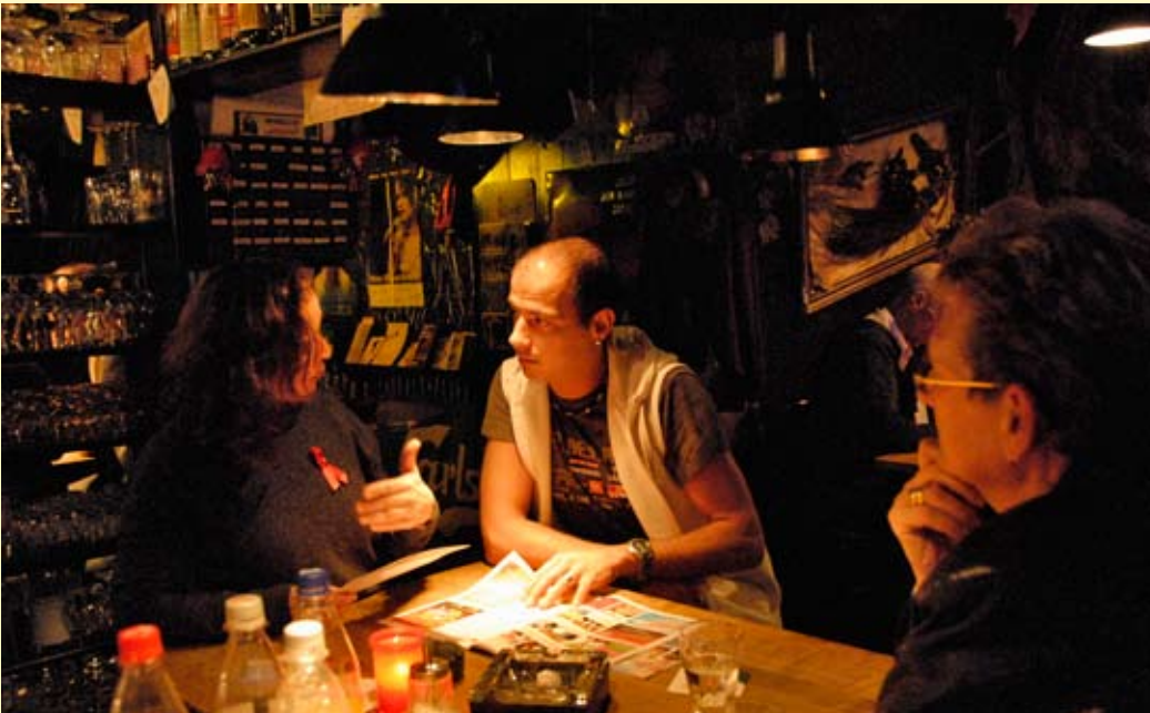
„Merlin's“ , Schwulenkneipe, Hochstraße 65