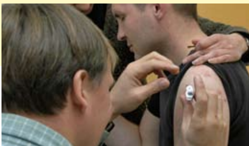
„Gleis 1“ , niederschwellige Drogeneinrichtung, Döppersberg