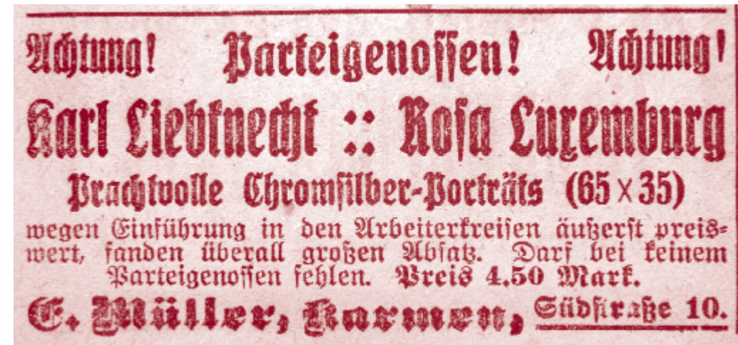
Anzeige „Volkstribüne“ – Zeitung der USPD, Elberfeld, Juni 1919

Der Eintritt ist frei. Es gilt das Prinzip „Pay what you like“.