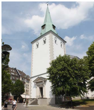
Evangelische Kirche Wald