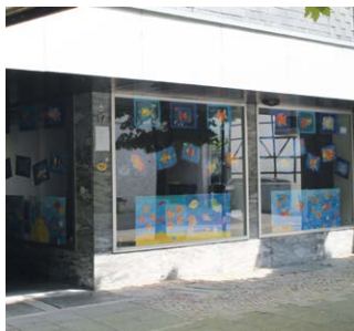
ehemals "Radio Schippers"