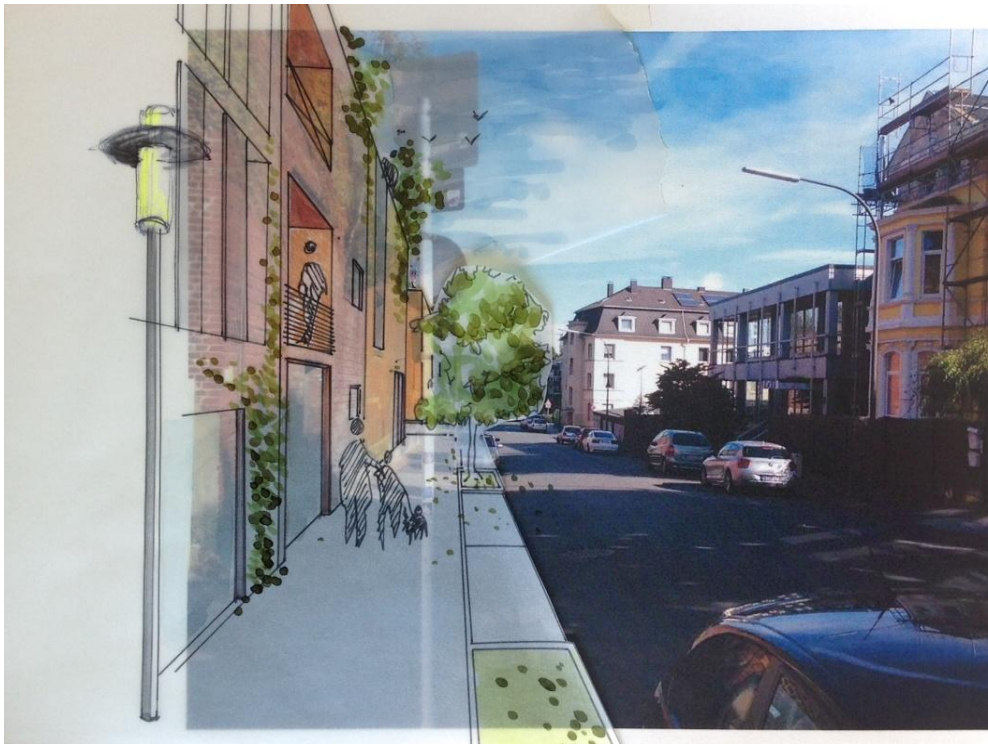
Perspektivische Darstellung der Wohnbebauung entlang der Spitzenstraße

Präsentation zum Forum Wohnstandort Wuppertal am 26.02.2014