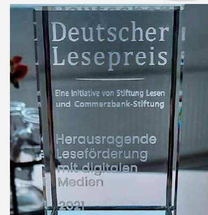
DEUTSCHER LESEPREIS 2021