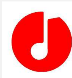
FILM- UND MUSIKSTREAMING