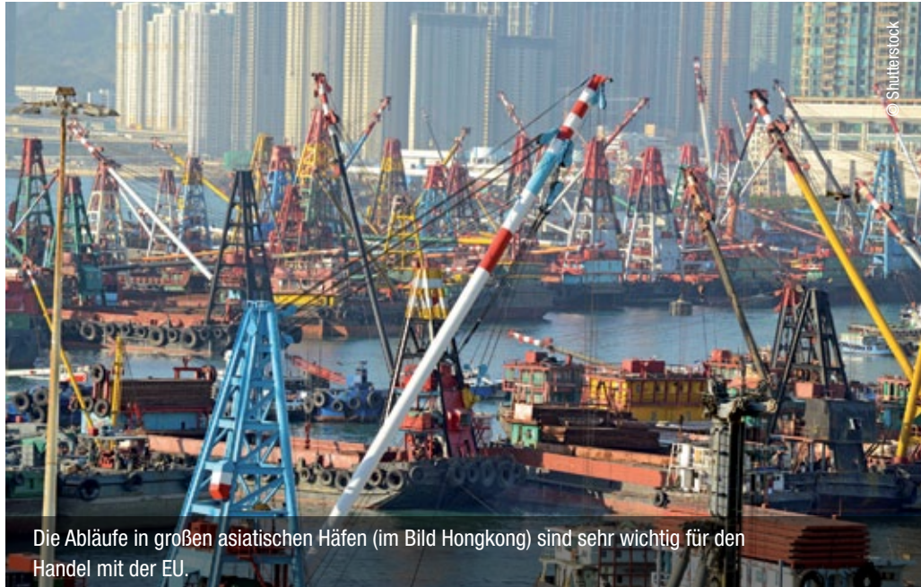
Die Abläufe in großen asiatischen Häfen (im Bild Hongkong) sind sehr wichtig für den Handel mit der EU.