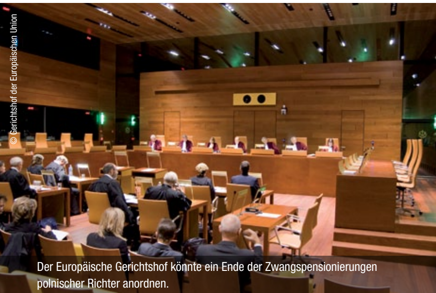
Der Europäische Gerichtshof könnte ein Ende der Zwangspensionierungen polnischer Richter anordnen.

> Sie hatte gegen das Gesetz Anfang Juli ein Vertragsverletzungsverfahren eingeleitet. Die von ihr vorgebrachten rechtlichen Bedenken zu dem Gesetz seien von der polnischen Regierung bisher nicht ausgeräumt worden, erklärte die Kommission.