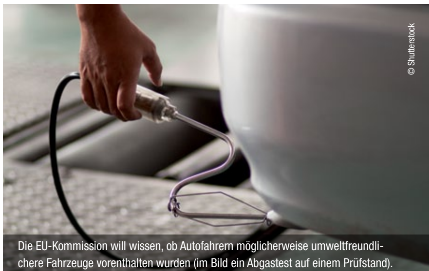
Die EU-Kommission will wissen, ob Autofahrern möglicherweise umweltfreundlichere Fahrzeuge vorenthalten wurden (im Bild ein Abgastest auf einem Prüfstand).

Die Europäische Kommission geht dem Verdacht nach, dass sich BMW, Daimler, Volkswagen, Audi und Porsche bei der Entwicklung und Vermarktung von Abgasreinigungssystemen abgesprochen haben könnten. Dazu hat die Kommission eine förmliche Prüfung eingeleitet. „Die Kommission will eingehender untersuchen, ob BMW, Daimler und VW vereinbart haben, bei der Entwicklung und Einführung wichtiger Technologien zur Verringerung der Schadstoffemissionen von Benzin- und Diesel-Pkw nicht miteinander zu konkurrieren“, sagte EU-Wettbewerbskommissarin Margrethe Vestager.