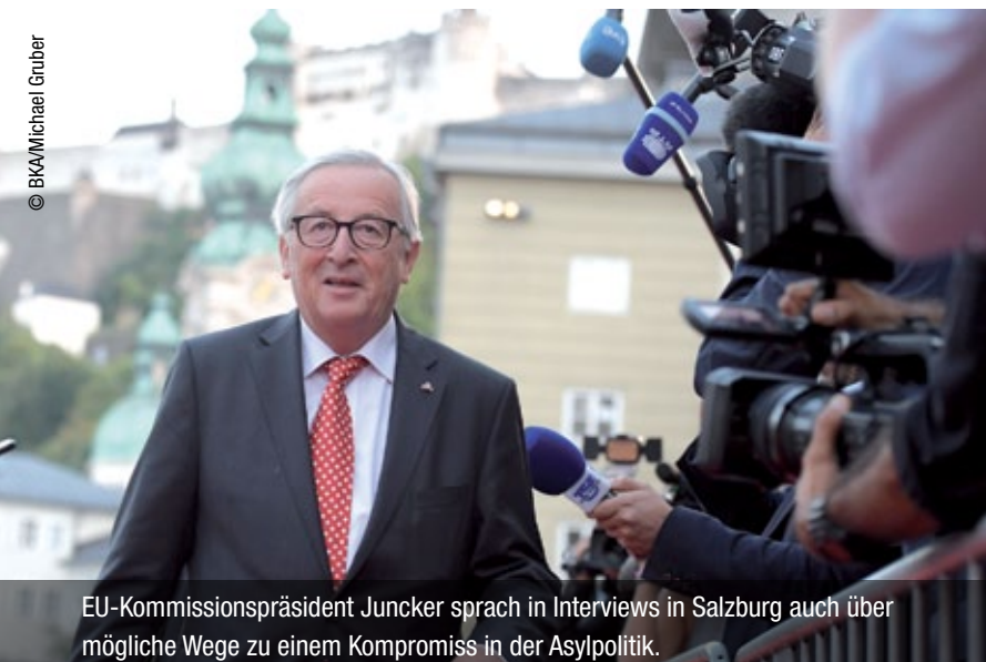
EU-Kommissionspräsident Juncker sprach in Interviews in Salzburg auch über mögliche Wege zu einem Kompromiss in der Asylpolitik.

Ein noch besserer Schutz der EU-Außengrenzen, verstärkte Zusammenarbeiten mit Drittstaaten – etwa in Nordafrika – und entschlossenes Vorgehen gegen Schlepper und Schleuser: Auf diese Hauptelemente setzt die EU weiterhin, um illegale Migration nach Europa einzudämmen. Beim informellen EU-Gipfel in Salzburg diskutierten die Staats- und Regierungschefs etwa über den jüngsten Gesetzesvorschlag der EU-Kommission, das Mandat der neuen EU-Grenz- und Küstenschutzwache zu erweitern und bis 2020 eine ständige Einsatzreserve von 10.000 Beamten aufzubauen. Darüber habe es einen „Grundkonsens“ gegeben, sagte EU-Kommissionspräsident Jean-Claude Juncker nach dem Gipfel. Er geht davon aus, dass es bis Jahresende zu einer Einigung kommt.