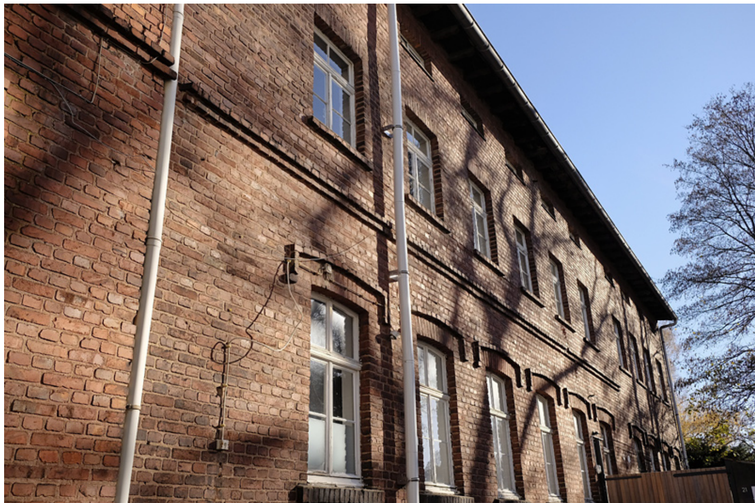
Atelier 1. OG