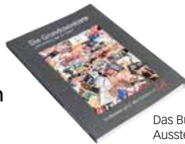
Das Buch zur Ausstellung 20,- €