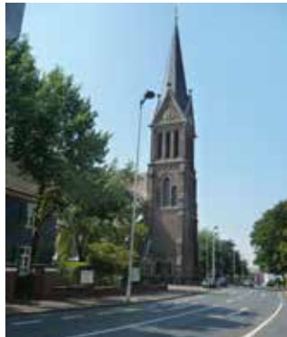
Katholische Kirche St. Joseph