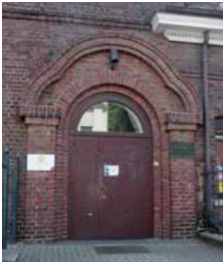
Kath. Gemeindehaus St. Joseph, Großer Saal, Hackhauser Str. 16.