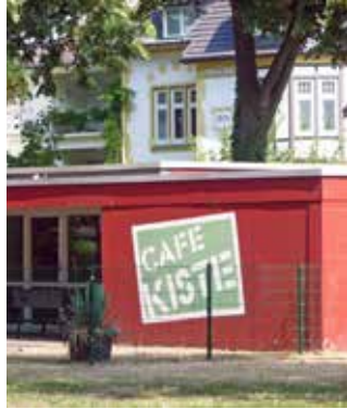
Café Kiste, Jugendcafé der Ev. Kirche