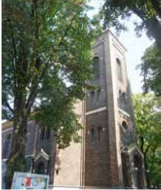
Evangelische Kirche Ohligs