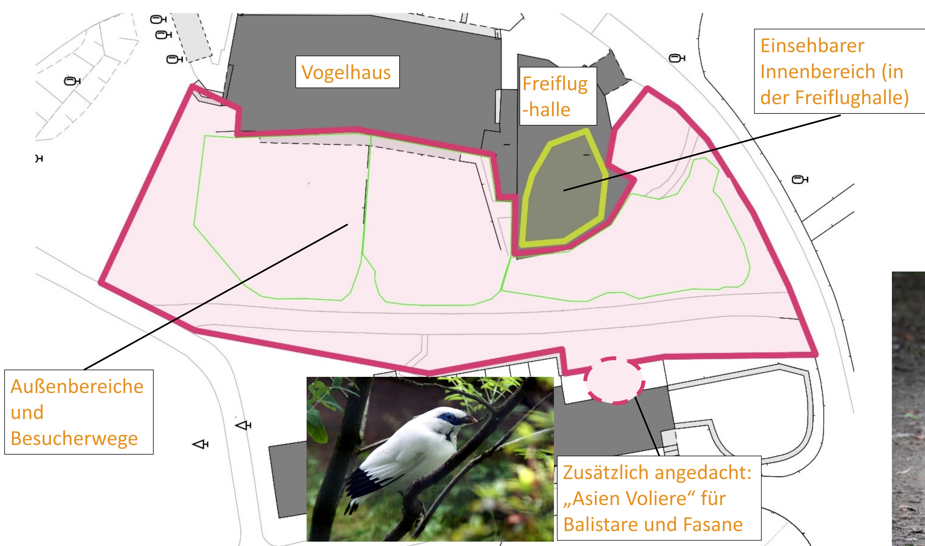
Unterhalb des Vogelhauses soll die etwa 3.300 m 2 große neue Anlage Rivers of Sulawesi für Hirscheber und Kurzkrallenotter entstehen.

Ein „Dschungel-Pfad“ soll die Attraktivität der Anlage noch weiter erhöhen.