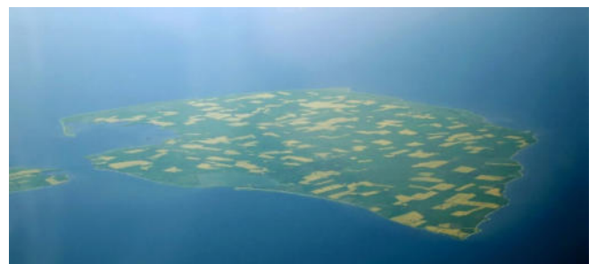
Luftbild von Fehmarn

Nach der Ankunft Zimmerbezug für eine Übernachtung und gemeinsames Abendessen in einem ausgewählten Restaurant.