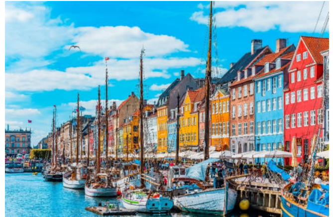
Kopenhagen Nyhavn

Rückfahrt zum Hotel und gemeinsames Abendessen in einem ausgewählten Restaurant.