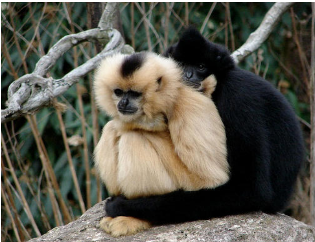
Weißwangen Schopfgibbon

Am Vormittag Fahrt zum Zoologisk Have , dem traditionsreichen Zoo von Kopenhagen, der seit seiner Gründung im Jahr 1859 zu den bedeutendsten Tiergärten Europas zählt. Das von Norman Foster entworfene Elefantenhaus, die eindrucksvolle Eisbärenwelt mit ihren Beobachtungsmöglichkeiten über und unter Wasser sowie die Tropenhalle sind nur einige Höhenpunkte des Zoos. Auch die weitläufige Afrika-Savanne mit Nashörnern, Giraffen und Zebras sind einen Besuch wert. Darüber hinaus widmet sich der Zoo in internationalen Zuchtprogrammen seltenen Arten wie dem Okapi und dem Amurleoparden .