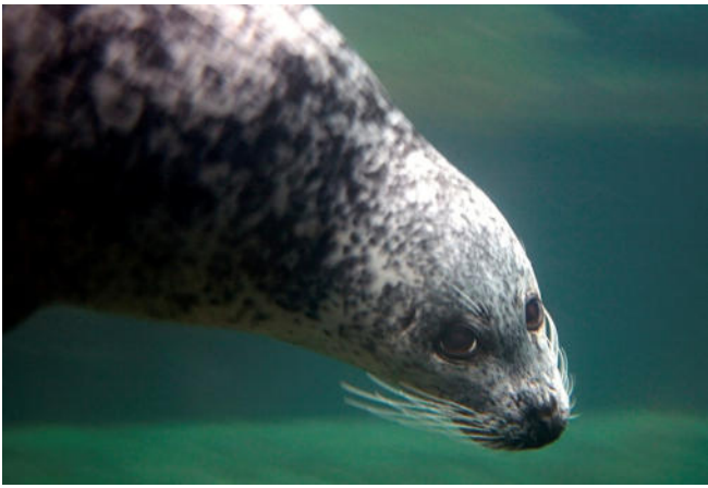
Seehund im Zoo Odense