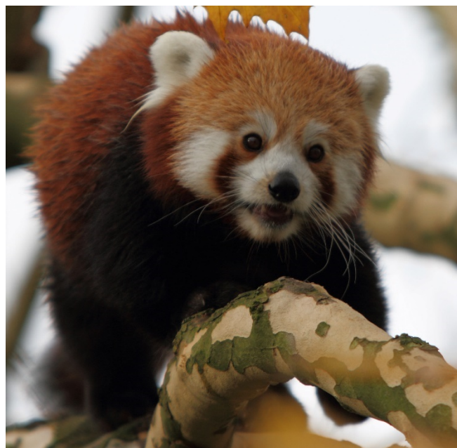
Roter Panda im Diergaarde Blijdorp

Am Abend kehren Sie in Ihr Hotel in Rotterdam zurück. Gemeinsames Abendessen in einem Restaurant.