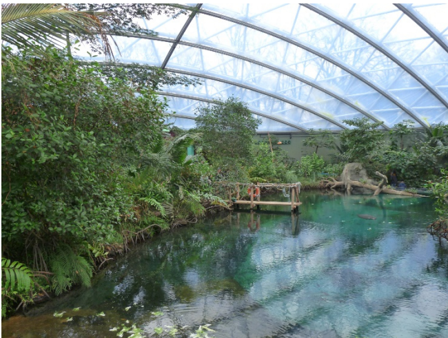
Burgers' Mangrove

Sie beginnen Ihre Reise am Morgen mit der Fahrt von Wuppertal nach Apeldoorn (Vorübernachtung und weitere Zustiege auf Anfrage). Einmal angekommen, wartet der Zoo Apenheul auf Ihren Besuch. Apenheul ist ein auf Primaten spezialisierter und etwa 11 Hektar großer Zoo, in dem sich ein Teil der Affen frei bewegen kann . Auf seinem idyllischen, grünen Gelände beherbergt der Zoo 35 Affenarten, vom Totenkopffäffchen bis zum Gorilla. Daneben wirbt Apenheul mit dem „ größten Insektenhotel der Welt “. Die tierischen Bewohner können in naturnahen Anlagen, bei Futterpräsentationen der Tierpfleger oder auch ganz hautnah beobachtet werden. Nach einem ausführlichen Besuch fahren Sie zu Ihrem Hotel bei Arnheim. Zimmerbezug für 2 Übernachtungen und gemeinsames Abendessen im Hotel.