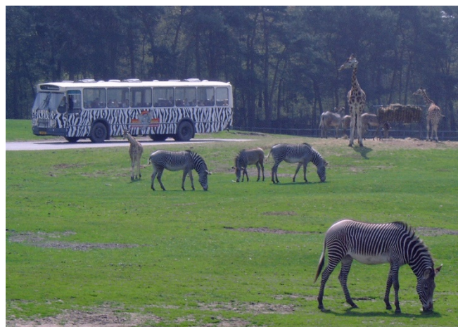
Safaripark in Beekse Bergen CCBYSA3.0 SQCK at-wikimedia.commons

Anschließend lernen Sie Rotterdam vom Wasser aus kennen und begeben sich auf eine unterhaltsame Hafentrundfahrt . Am Abend spazieren Sie vom Hotel aus zu einem Restaurant. Dort lassen Sie den Tag mit einem gemeinsamen Abendessen ausklingen.