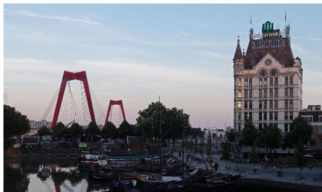
Witte Huis im Oude Haven

Der Nachmittag steht Ihnen zur freien Verfügung. Gemeinsames Abendessen in einem Restaurant.