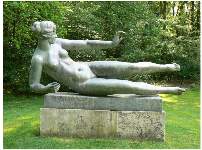
L'Air von Aristide Maillol im Kröller-Müller-Museum CC0 at-wikimedia.commons

Eine kurze Fahrt führt Sie heute zum Königlichen Burger's Zoo in Arnheim . Der Tiergarten ist bekannt für seine sehr großen Hallen, in denen Tiere und Pflanzen aus bestimmten Landschaften zusammengeführt wurden. Diese Präsentationen werden auch als „Ökodisplay“ bezeichnet. In Burgers' Bush begegnet man Tieren aus dem tropischen Regenwald wie zum Beispiel Erdferkeln oder Kaimanen. Burgers' Desert beherbergt Tiere aus der amerikanischen Wüste wie Rennkuckuck oder Baumstachler. In Burgers' Ocean begibt man sich auf eine Entdeckungsreise durch ein Korallenriff vom Strand bis unter die Wasseroberfläche, Burgers' Mangrove beherbergt eine Lebensgemeinschaft aus dem Mangrovenwald, der an den Wechsel zwischen Ebbe und Flut angepasst ist. Hier kann man auch die nur selten gezeigten Seekühe bewundern . Eine große afrikanische Savannenlandschaft ist Heimat für Breitmaulnashörner, Zebras, Giraffen, Antilopen und Gnus.