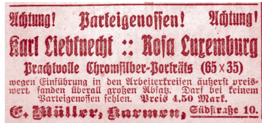
Anzeige „Volkstribüne“ – Zeitung der USPD, Elberfeld, Juni 1919

Der Eintritt ist frei. Es gilt das Prinzip „Pay what you like“.