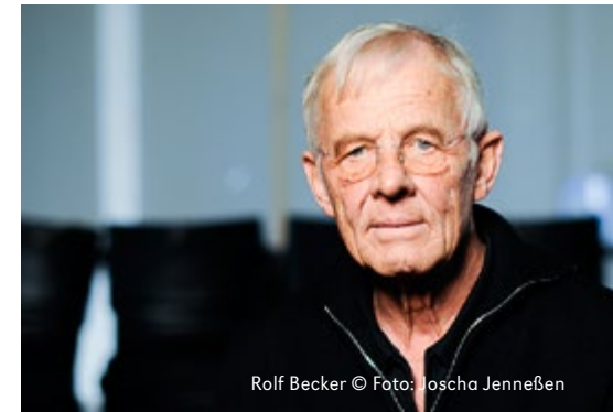
Rolf Becker