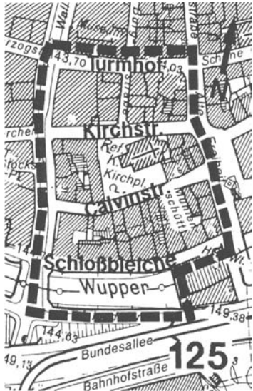
Ablichtung: Durchführungsplan Nr. 125 - Turmhof

Gebiet zwischen den Straßen Turmhof, Alte Freiheit, Islandufer und Wall.