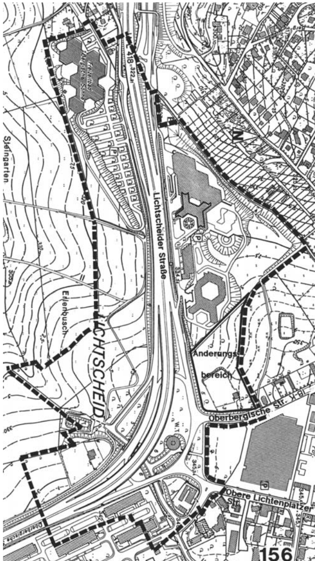
Ablichtung: Bebauungsplan Nr. 156

Gebiet zwischen dem Weg Obere Böhle, Lichtscheider Straße bis zu einer südlichen Tiefe von ca. 150m, Oberbergische Straße und Lichtscheider Kreuz.