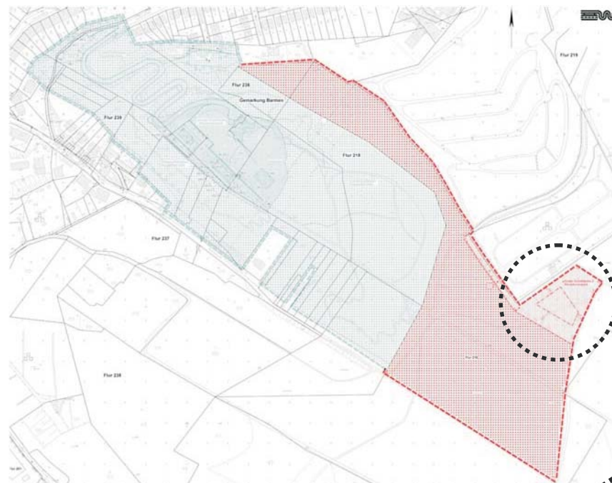
Bebauungsplan 1094 mit Erweiterungsbereich (rot)

Ressort Bauen und Wohnen (105.17) Michael Foerster Telefon: (0202) 563 6696 E-Mail: michael.foerster@stadt.wuppertal.de Johannes-Rau-Platz 1 42275 Wuppertal Zi. C 220 www.wuppertal.de/bebauungsplaene